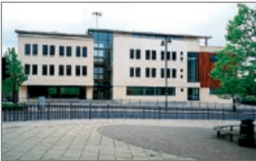
TESCOM EUROPE, Niederlassung UK