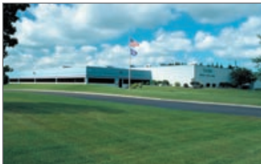
Tescom Corporation Zentrale, USA

TESCOM EUROPE GMBH & CO. KG Europazentrale An der Trave 23 - 25 D-23923 Selmsdorf Tel.: +49 (0) 3 88 23/31-0 Fax: +49 (0) 3 88 23/31-199 info@tescom-europe.com www.tescom-europe.com