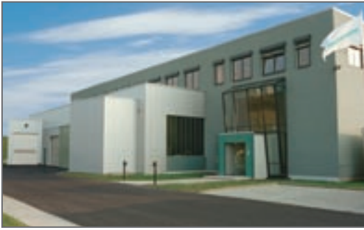
TESCOM EUROPE Zentrale, Deutschland